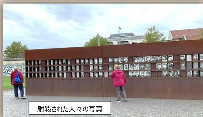
射殺された人々の写真

「贖罪礼拝堂」という建物もありました。1894 年に建造された贖罪教会を旧東ドイツが爆破破壊し、ベルリンの壁が崩壊するまで放置されていたのを、再建したものです。