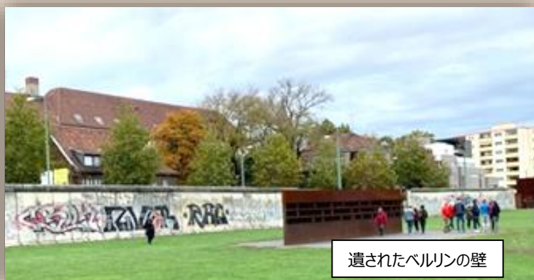
遺されたベルリンの壁